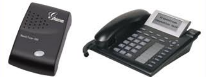
VMESNIK HT-286 GRANDSTREAM GXP-2000

Zastopamo zelo popularnega ponudnika VoIP telefonskih aparatov in vmesnikov GRANDSTREAM