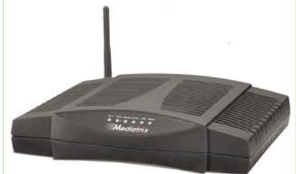
MEDIATRIX LAISON vmesnik za priklop ATA telefonov in telefaxov.

IP Time office server 4.0™ (Build 40582)