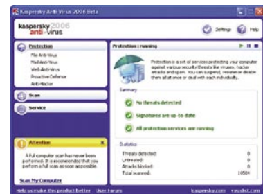
Slika1: Uporabniški vmesnik novega protivirusnega programa Kaspersky - 2006.

Novost je tudi Kaspersky Antivirus "Web Scanner". Brezplačen protivirusni pregledovalnik, ki je nameščen na vašem računalniku in deluje v okviru Microsoft Internet Explorerja. Ko je naenkrat nameščen, deluje tudi brez povezave na internet. Ko želimo prenesti posodobitve, pa mora seveda biti le-ta aktivna. Vendar bodimo pozorni - "Web Scanner" nam sicer pregleda računalnik in očisti okužene datoteke, ne skrbi pa za neprekinjen nadzor nad dogajanjem v računalniku.